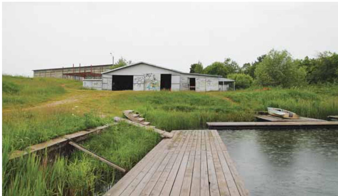
Гребная база в Дедовичах сегодня выглядит вот так.

5 октября псковские депутаты определятся с должностями в областном Собрании. В пресс-службе Псковского областного Собрания сообщили, что в этот день оргкомитет должен обсудить, кто получит посты вице-спикеров, председателей и заместителей председателей оргкомитетов — в дальнейшем их будет утверждать весь состав Собрания на первой сессии. В соответствии с законодательством все политические фракции имеют право на штатные должности в парламенте. Предварительно большая часть постов будет унаследована из предыдущего состава Собрания. В частности, на должность председате-