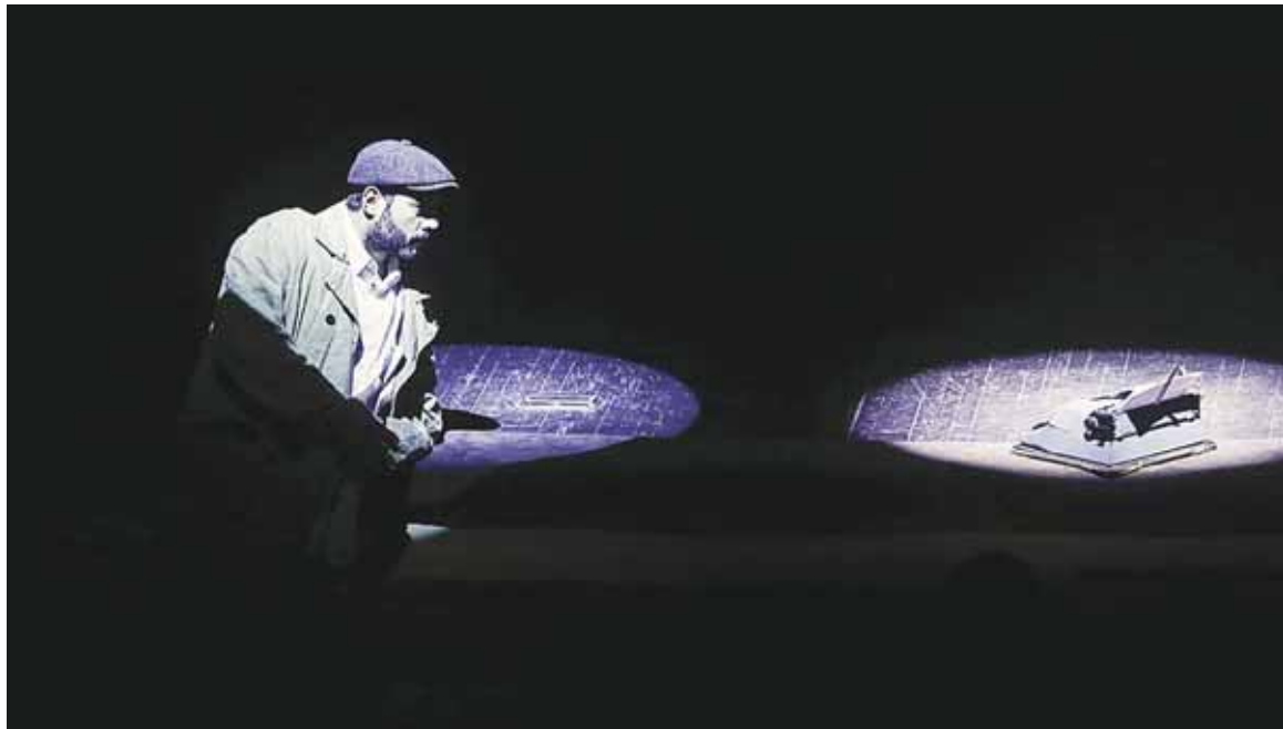
Сцена из спектакля «Человек, обречённый на счастье».