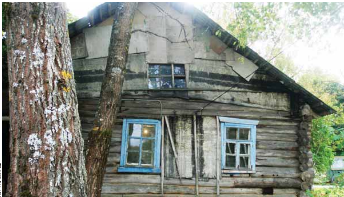
Дом-музей Довлатова, д. Березино.

лась. Это был тот самый «отдельный вход», который в повести «Заповедник» Михал Иваныч выбивает ногой. За приоткрывшейся дверью на ступеньках стояли коробки с продуктами. Там готовился фуршет «на газетах». Ливерная колбаса, солёные и маринованные огурцы, консервы, квашеная капуста, деревенский самогон, яблоки... Артисты возле дома читали Довлатова, потом их место заняли музыканты... Возле дерева на воздушных шарах висел портрет-шарж Довлатова, а под ним нечто, замаскированное газетами. В нужный момент, вскоре после того, как один из шаров лопнул, остальные шары, портрет и предмет, замаскированный газетами, перенесли в раковине, висящей на наружной стене покосившейся избы. Оказалось, это был деревенский умывальник, наполненный самогонкой. Любимой моч с этим умывальником чокнуться. Одним из первых подошёл Павел Лунгин.