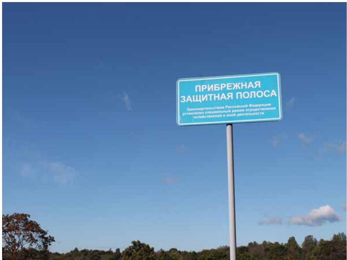
После публикации «Локносское чудовище» один из героев материала потребовал опровержения.