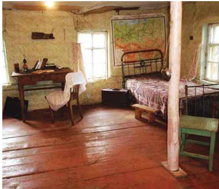
Кровать в доме-музее Довлатова.