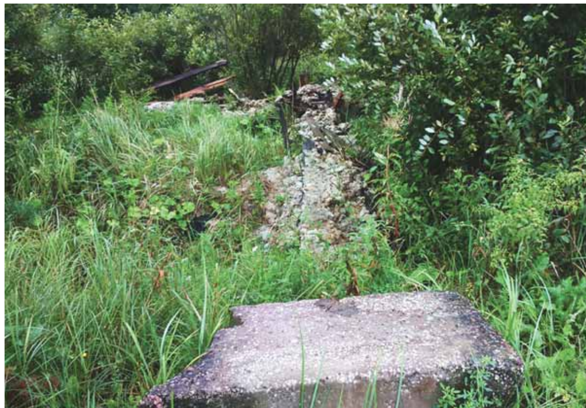
Так выглядят остатки теплотрассы в деревне Цевло Бежаницкого района.

В Цевло к такому покаянию отнеслись без понимания. «Нас обманули, оставили без единственной дороги, без возможности ездить за клюквой. Хорошо хоть три недели