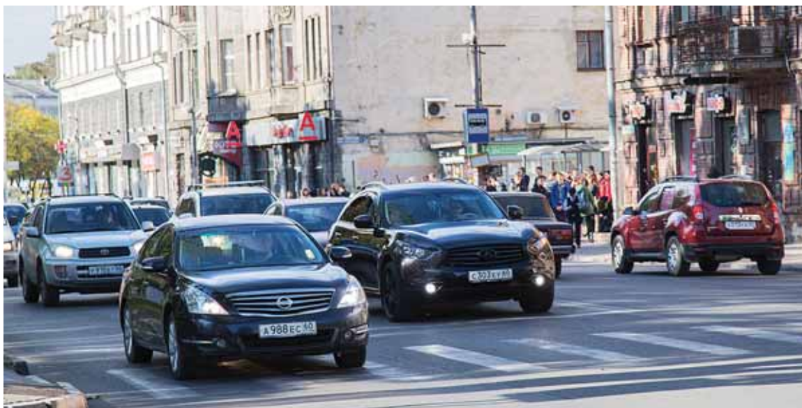
Продажи автомобилей в России за 8 месяцев 2016 года упали почти на 20 процентов.

Губернатор Андрей Турчак, кажется, первым обратил внимание общественности на то, что Псковская область в последние годы стабильно входит в число наиболее «автомобилизированных» регионов страны. Понятно, что он попросту пытался оправдать другую статистику: в 2015 году провластное агентство «РИА Рейтинг» сообщило, что жители нашей области – самые бедные в стране. Но факт остаётся фактом: даже несмотря на то, что регион постепенно теряет позиции по обеспеченности населения легковыми автомобилями, область остаётся в первой десятке рейтинга. «Псковская губерния» проанализировала, насколько можно доверять этим числам, а также выяснила, какие автомобили предпочитают покупать россияне в 2016 году, когда перестанут расти цены на новые отечественные авто и в каком году водителям ждать обновлённой версии популярной «Лады Гранты».