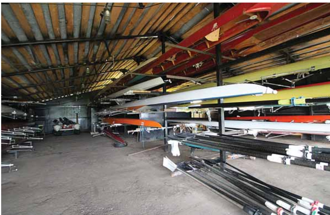
В Дедовичской ДЮСШ половина лодок - питерские.