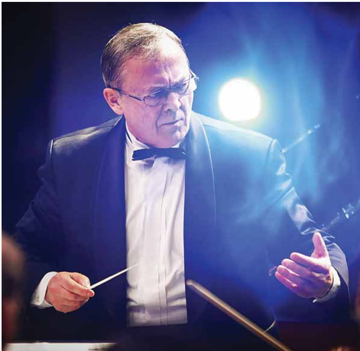
Евгений Шестаков, главный дирижёр Тюменский государственного симфонического оркестра.

Crescendo юного музыканта - это аванс (так юниоров выпускают в конце футбольного матча взрослых