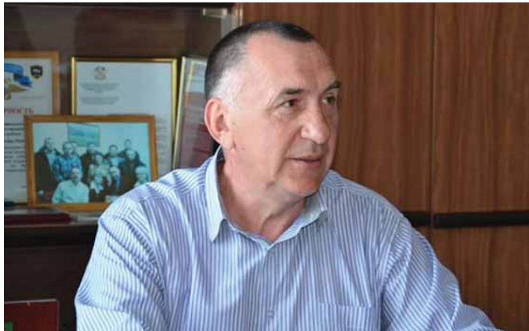
Глава Невельского района Александр Ващенко.