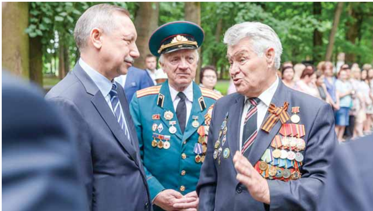
Полпред президента в СЗФО Александр Беглов.