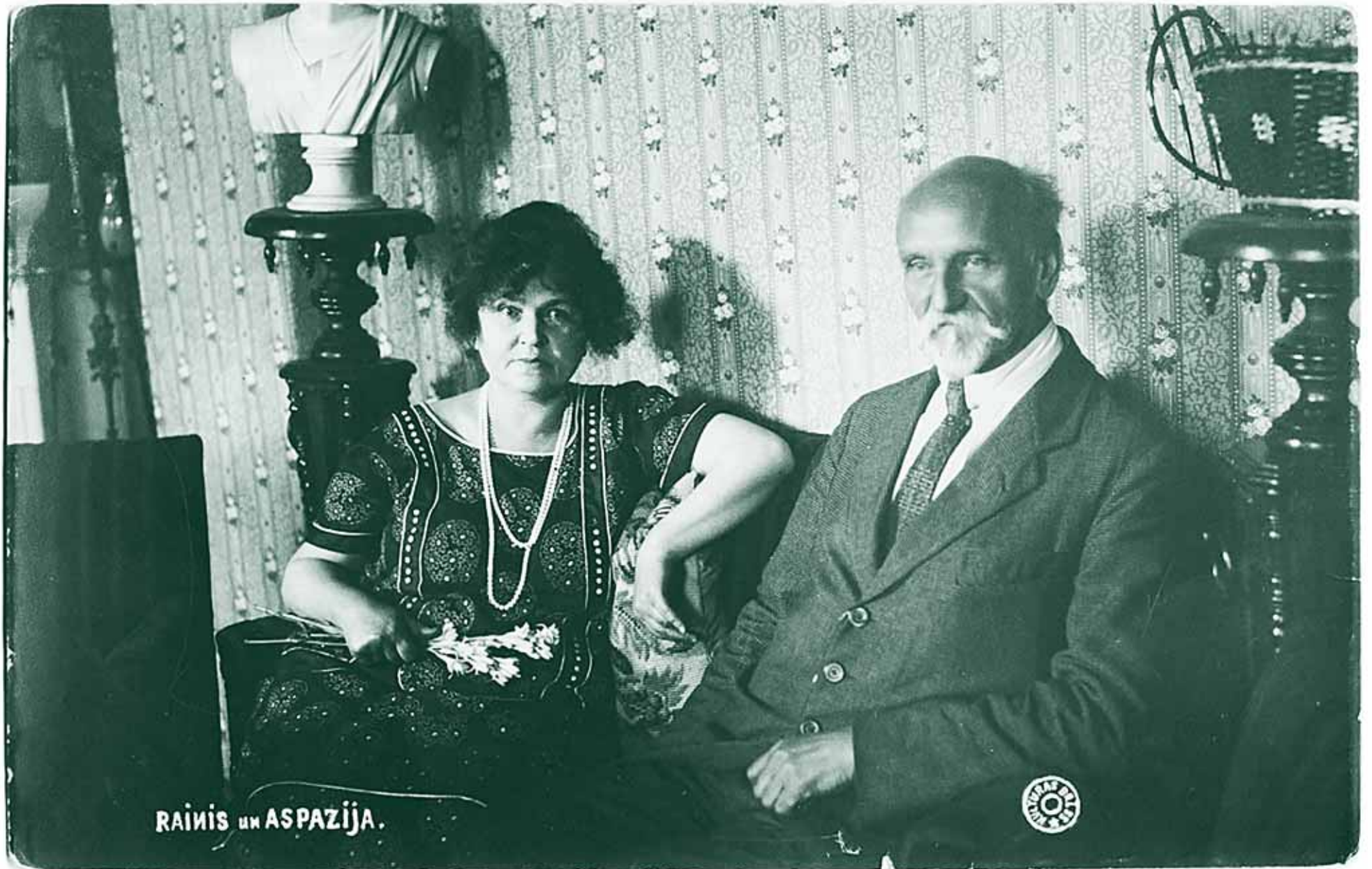
Аспазия и Ян Райнисы.