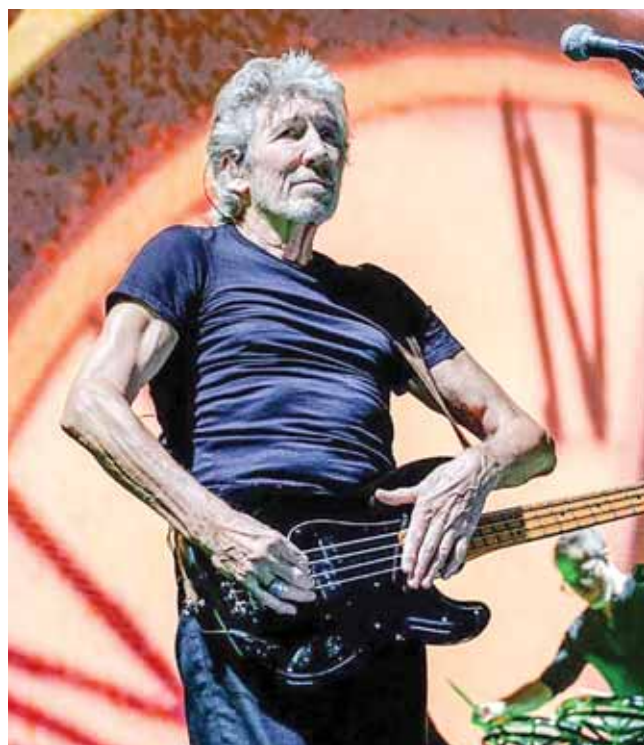
Роджер Уотерс, Петербург, 29 августа 2018 года.