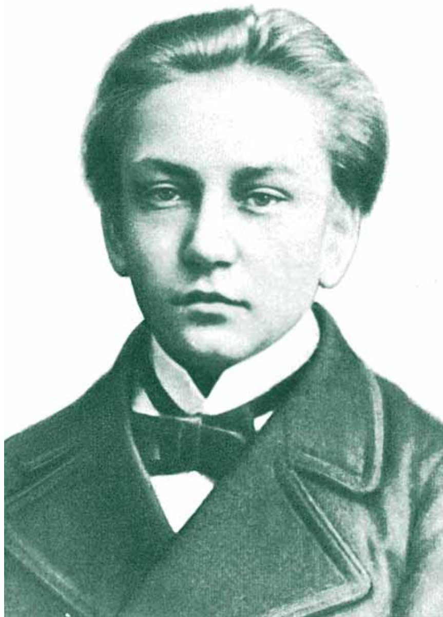
Иван Плиекшан (Ян Райнис) в 1880 году.