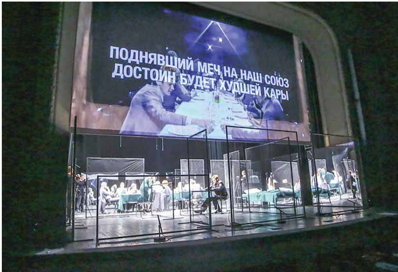
Сцена из спектакля «Ревизор».

– Мне кажется, это прекрасно, если зритель, сидя в зале, испытывает неудобство от того, что узнаёт в