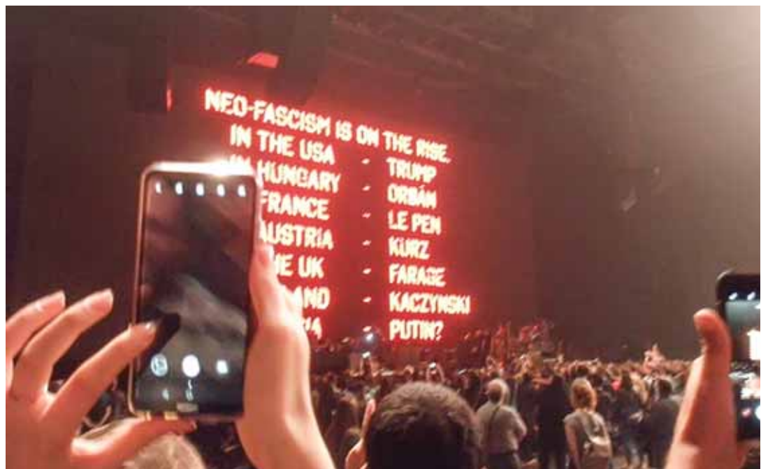
Список «неофашистов» по версии Роджера Уотерса. Петербург, 29 августа 2018 года.

Шоу Us+Them – это избранные композиции Pink Floyd . Лучшее из лучшего. В основе – самый популярный альбом The Dark Side of the Moon («Обратная сторона Луны») 1973 года.