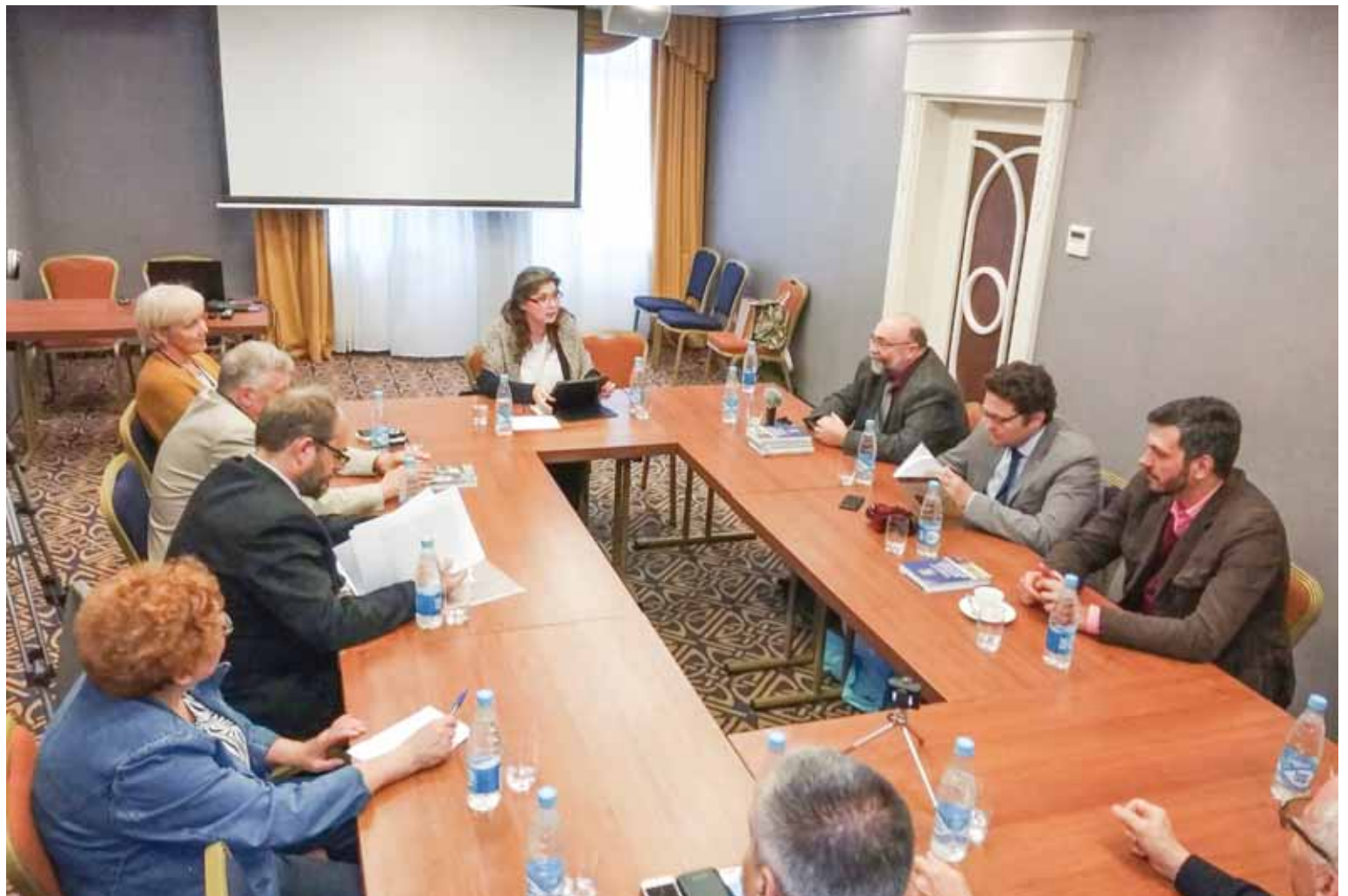
Во время псковской научной конференции «Ледовое побоище. Взгляд из XXI века».