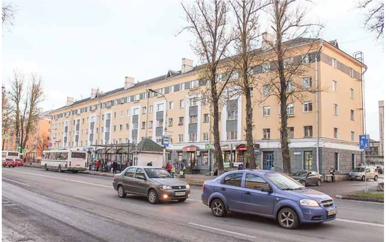
Дом №39 на Октябрьском проспекте, который отремонтировала бригада Испайхановых.