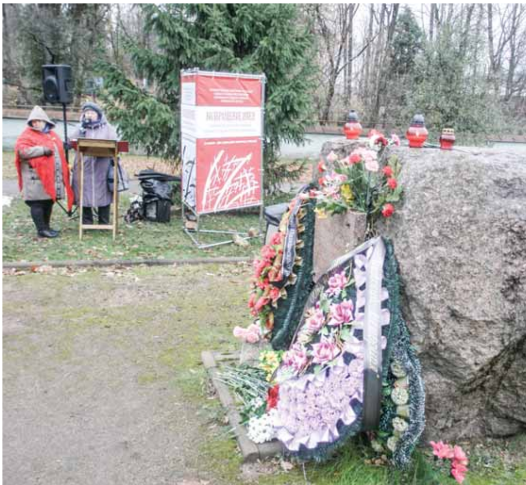
Псков. Акция «Возвращение имён», 30 октября 2018 г.

Вот несколько цитат из ноябрьского доклада Горбачёва 1987 года: «Руководящее ядро партии, которое возглавлял И. В. Сталин, стояло ленинизм в идейной борьбе, сформулировало стратегию и тактику на начальном этапе социалистического строительства, получило одобрение политического курса со стороны большинства членов партии и трудящихся».