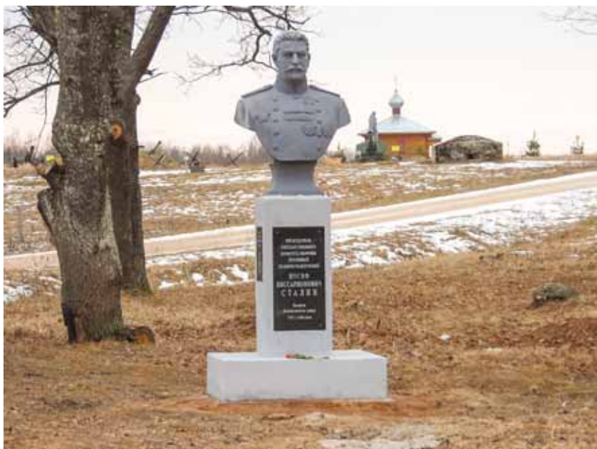
Бюст Сталина в Островском районе Псковской области, 2016 г.

Собирательный образ героя всех времён стал сплетаться из «столыпинских галстуков», гулаговской колючей проволоки и прочих подручных вещей