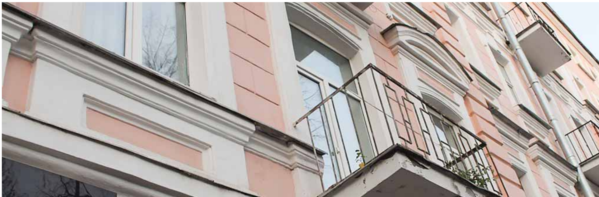
Дом №38 на Октябрьском проспекте. / Фото: Павел Дмитриев